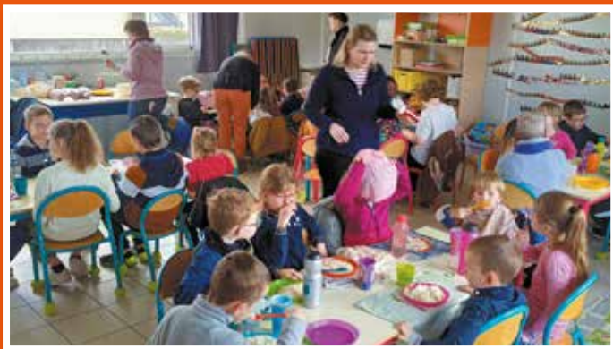
L'association est venue rendre visite aux élèves le matin même.

Au menu : bol de riz et pomme. Cette action avait pour but de récolter de l'argent pour l'association Casa Honduras, qui œuvre pour l'éducation des enfants et pour de meilleures conditions de vie.